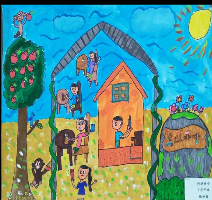
西埔國小 五年甲班 楊若盈