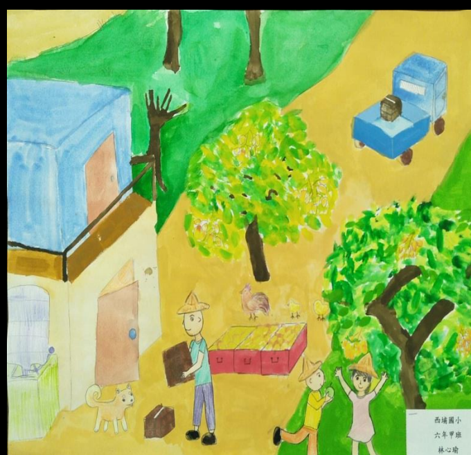
西埔國小 六年甲班 林心瑜