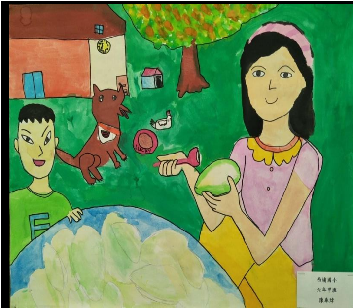
西埔國小 六年甲班 陳奉煒