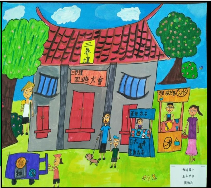
西埔國小 五年甲班 周怡辰